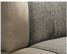
+ Wohnwelt Camino