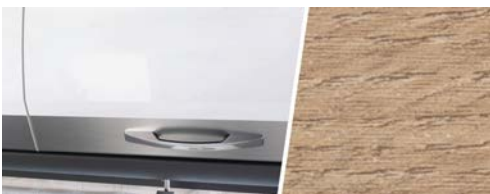
+ Holzdekor Amberes Oak