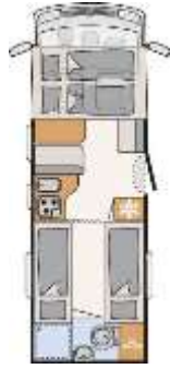
I 7017 EB