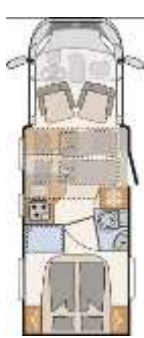
T 6757 DBM