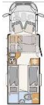
T 7017 EB