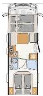
I 7057 DBL