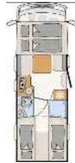
I 7057 EBL