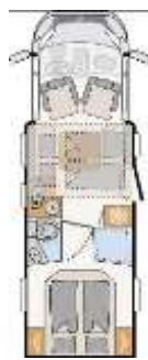
T 7057 DBL