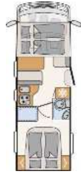
I 7057 DBM