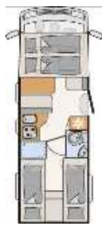
I 7057 EB