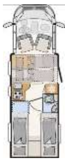
T 7057 EB