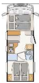
I 6757 DBM