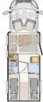
T 7057 EBL