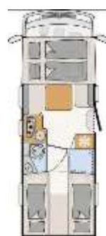
T 7057 EB I 7057 EB Neu: T 7057 DBL Neu: I 7057 DBL Neu: T 7057 EBL Neu: I 7057 EBL