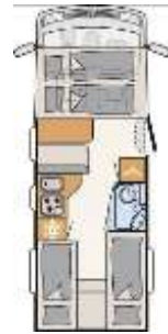
Neu: T 6557 DBM Neu: I 6557 DBM T 6611 EB I 6611 EB T 6717 EB I 6717 EB