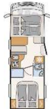
T 6757 DBM I 6757 DBM T 7017 EB I 7017 EB T 7057 DBM I 7057 DBM