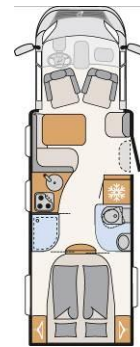
T 7150-2 DBT