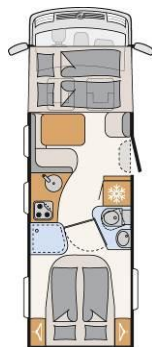
I 7150-2 DBM