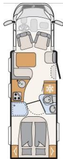
T 7150-2 DBM